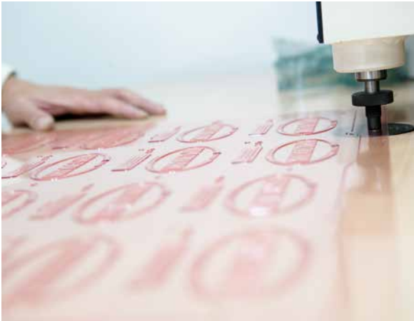
Offsetdruck, Flexodruck, Tiefdruck – in der GMG OpenColor Datenbank sind alle prozessrelevanten Faktoren hinterlegt

Die Teststellung war ein voller Erfolg. Für alle Beteiligten war die drucktechnische Umsetzung vom Digitalproof zum Fortdruck mehr als überzeugend. Mittlerweile konnte Janoschka weitere Kunden von den Vorteilen von OpenColor überzeugen, so dass es zwischenzeitlich ein großes Portfolio an Substraten, Druckmaschinen und Sonderfarben für den Einsatz von OpenColor gibt.