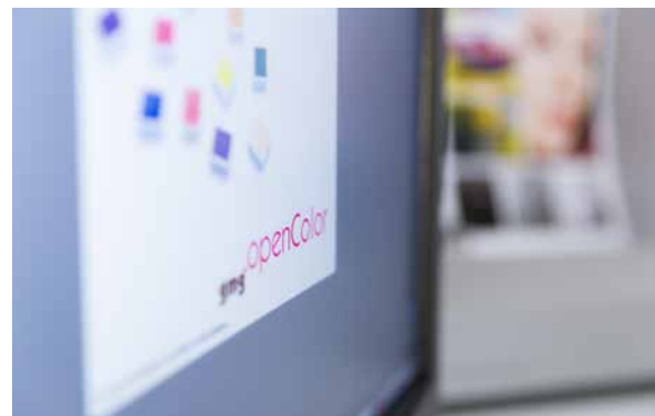
GMG OpenColor wird nahtlos an GMG ColorProof angebunden

Da Janoschka seit vielen Jahren sämtliche Proofs mit GMG ColorProof und Epson Druckern erstellt, war es ein logischer Schritt für schwierige Druckmotive mit Sonderfarben die Erweiterung GMG OpenColor unter die Lupe zu nehmen.