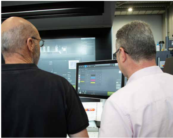
Bei Denny Bros stimmt die Farbe: dank der Heidelberg XL 75 Anicolor und der Software von GMG.

Carbon Charter Gold sowie die Zertifizierung nach ISO 14001:2015.